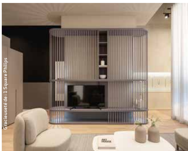
Gracuseté de : 1 Square Philips

(1) Voir statistiques sur le site apciq.ca