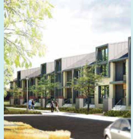
LE QUATRIÈME - DORVAL Partenaires : Gestion PCA et Ipso Facto