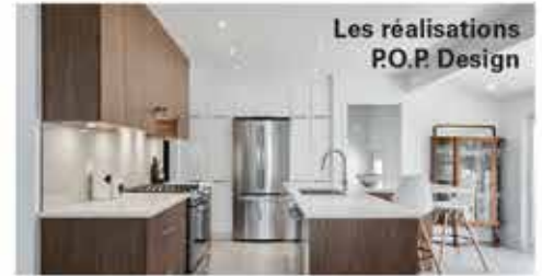
Les réalisations P.O.P Design