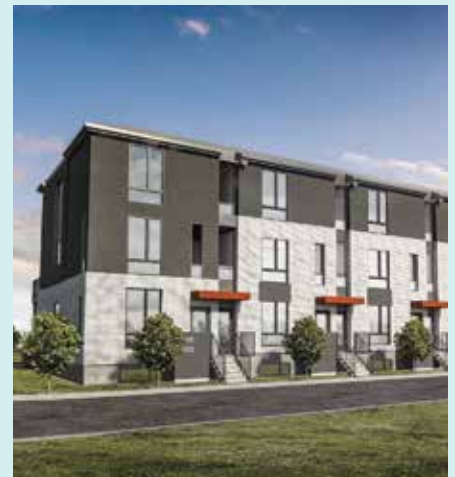
ALVÉO - MIRABEL Partenaire : Cogir Immobilier