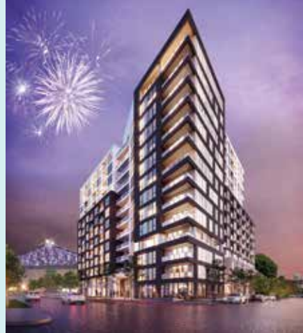
AUGUSTE & LOUIS - MONTRÉAL Partenaire : Devimco Immobilier