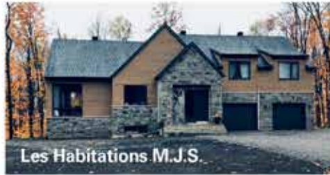
Les Habitations M.J.S.