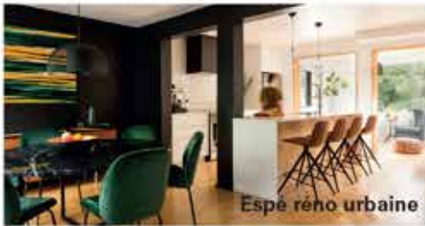
Espe réno urbaine