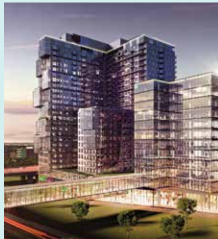
SOLAR UNIQUARTIER - BROSSARD Partenaires : Devimco Immobilier et Fondation