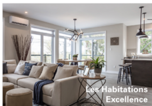
Les Habitations Excellence