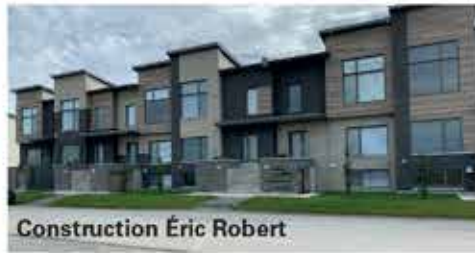
Construction Éric Robert