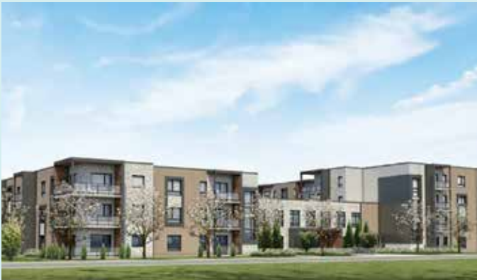
JOHANNESBOURG - SAINT-CONSTANT Partenaire: Groupe Alliancia