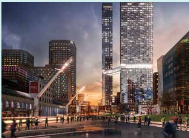
MAESTRIA – MONTRÉAL

Partenaires : Devimco Immobilier et Fiera Immobilier