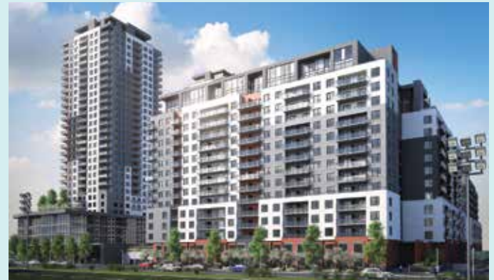
URBANIA 2 - LAVAL Partenaires : Société de développement Urbania