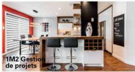
1M2 Gestion de projets