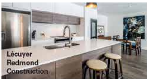
Lécuyer Redmond Construction