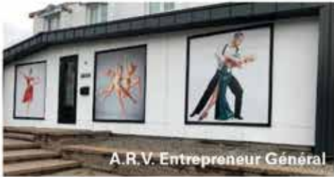
A.R.V. Entrepreneur Général