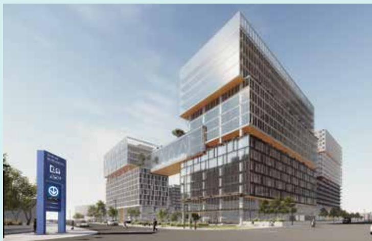
ESPACE MONTMORENCY – LAVAL

Partenaires : Devimco Immobilier et Fiera Immobilier