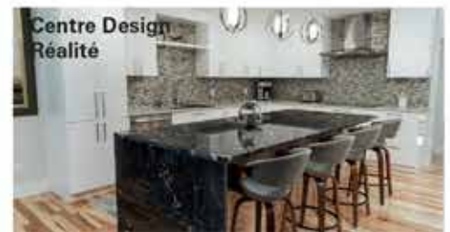
Centre Design Réalité