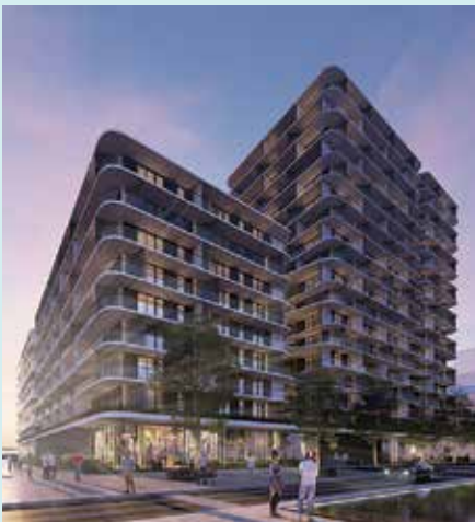
DISTRICT UNION - TERREBONNE Partenaire : Groupe Sélection