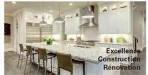
Excellence Construction Renovation