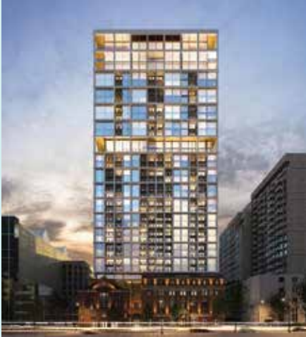
MAA - MONTRÉAL Partenaire : Devimco Immobilier