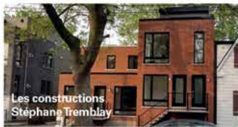
Les constructions Stéphane Tremblay