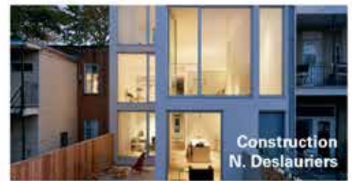
Construction N. Deslauriers