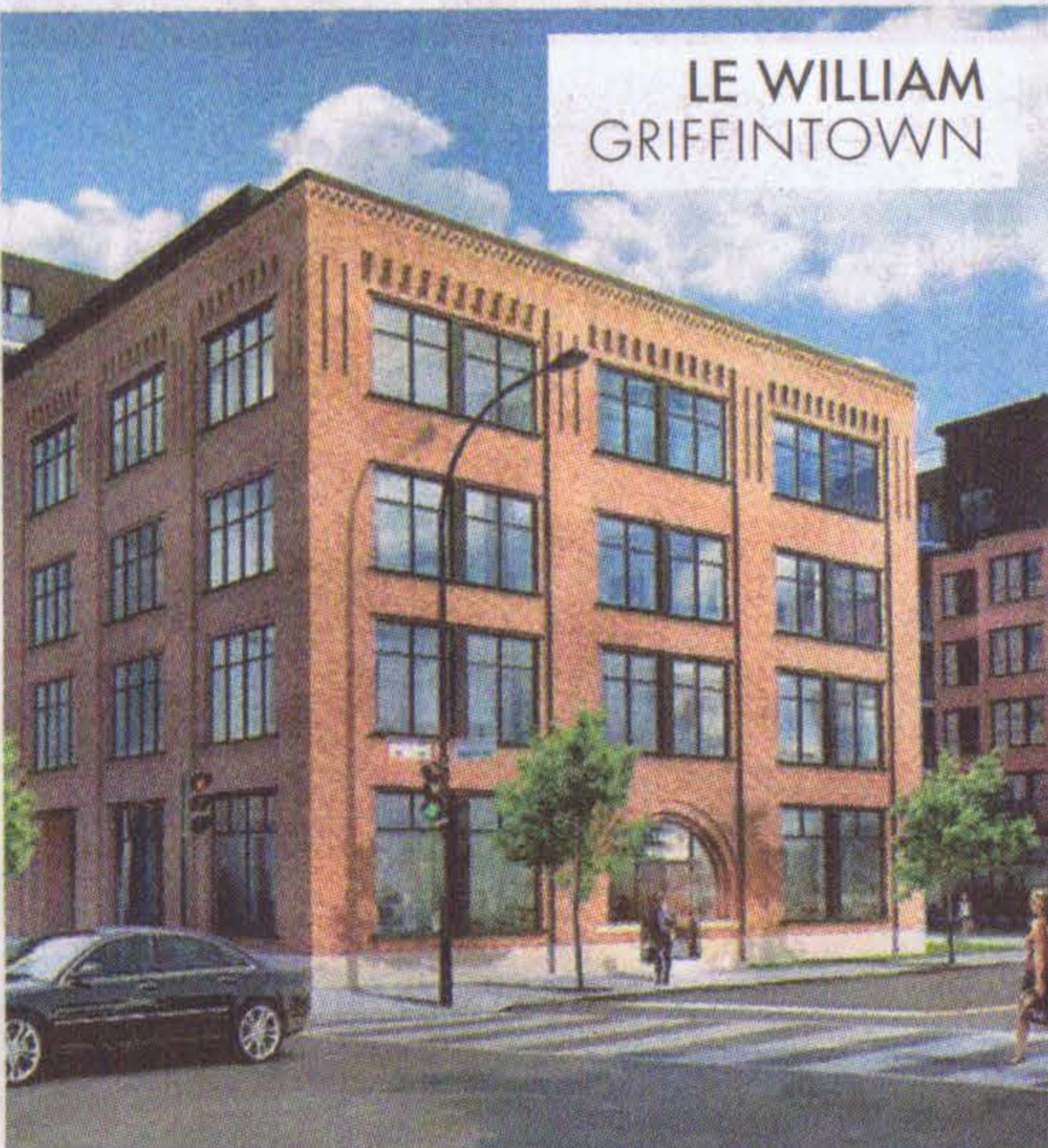
LE WILLIAM GRIFFINTOWN

Rappelons que ces visites libres se déroulent aujourd'hui et demain, de 13h à 17h. Soulignons également que les acheteurs pourront découvrir tous les projets ainsi que la fourchette de prix des diverses unités au www.monhabitationneuve.com .