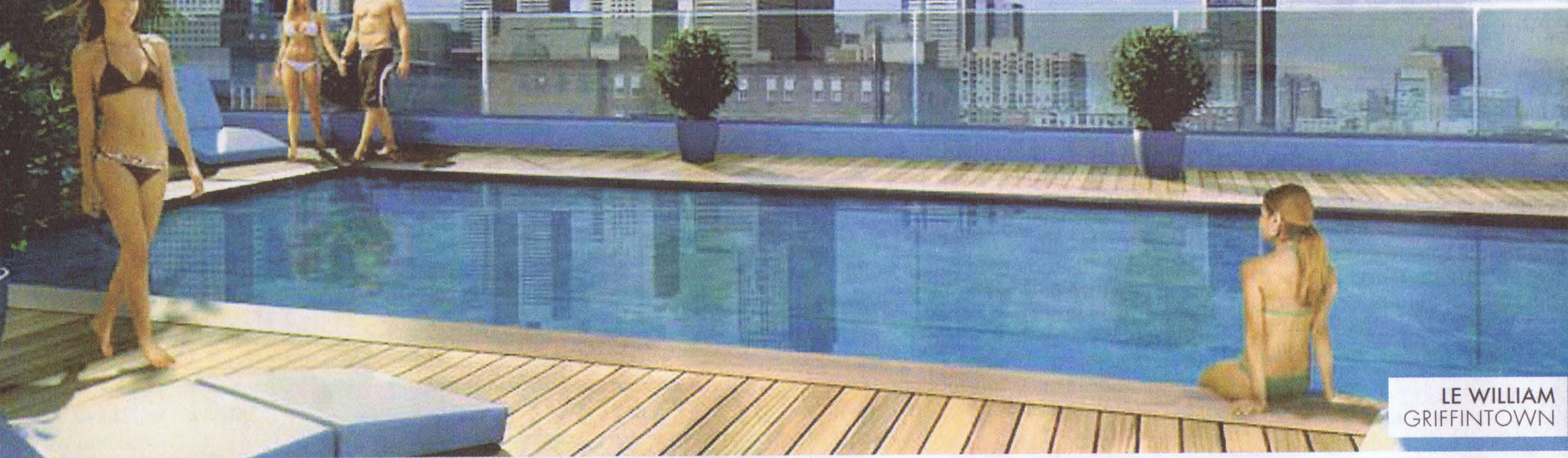
LE WILLIAM GRIFFINTOWN