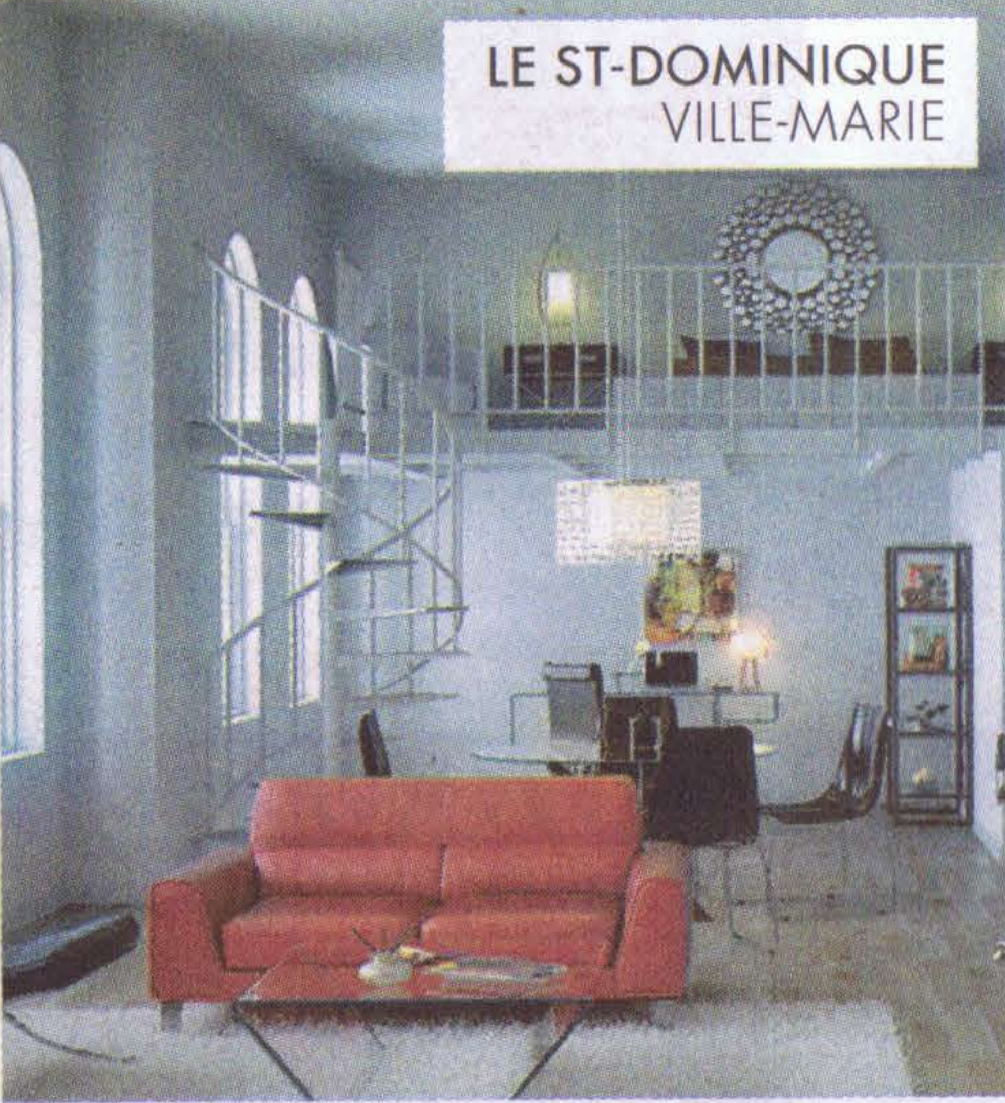
LE ST-DOMINIQUE VILLE-MARIE